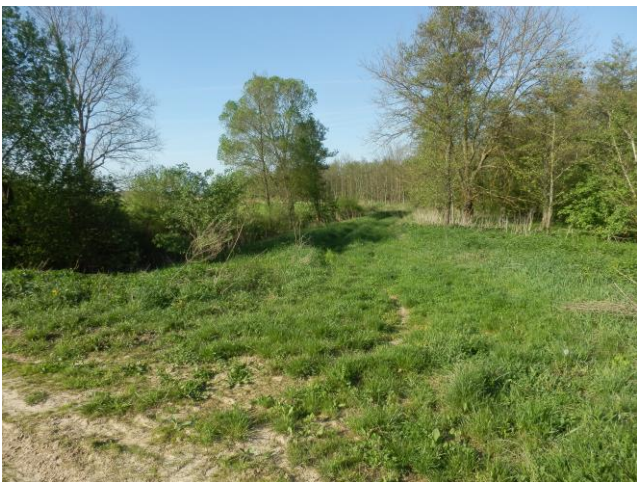
A Berki patak jobb oldali magas partja a hídról nézve