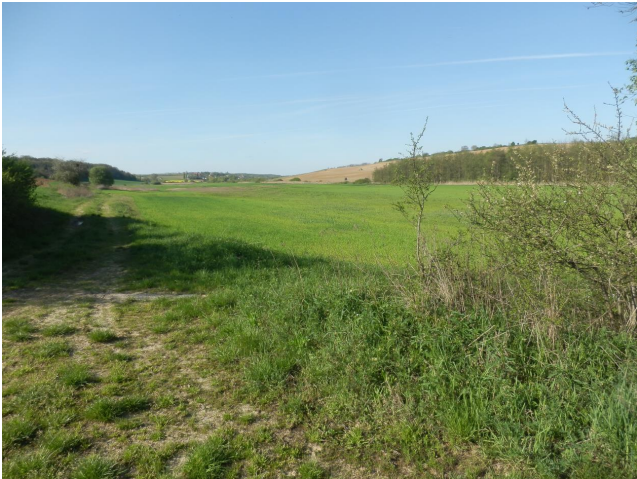
Az időszakosan elöntés alá kerülő terület., Bal oldalon a 0193. hrsz-ú dűlőút.