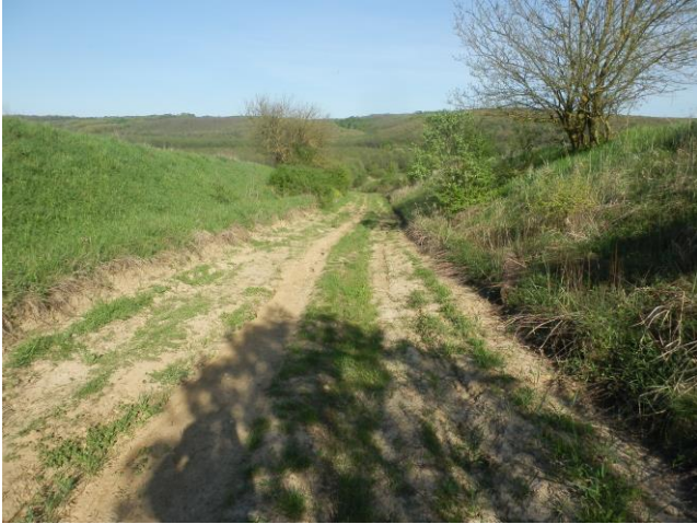
A berki patak hídjához vezető (0293 hrsz-ú) út