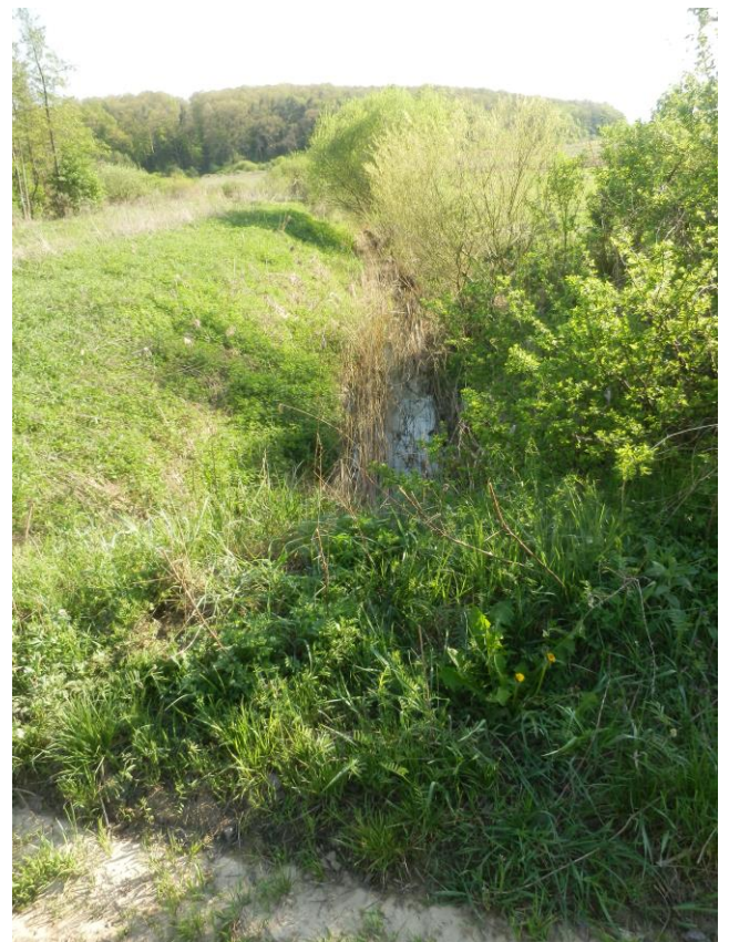
A Berki patak a híd déli oldalán